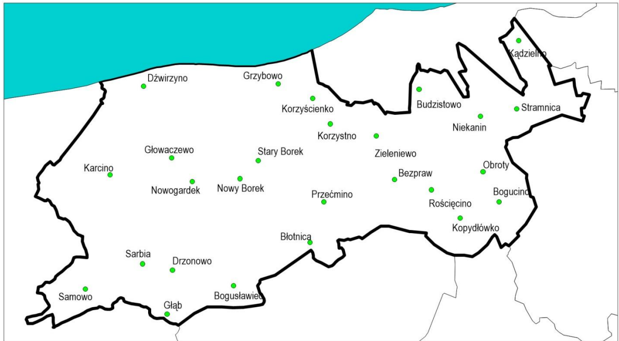
Rysunek 2. Miejscowości na terenie gminy Kołobrzeg (opracowanie własne)